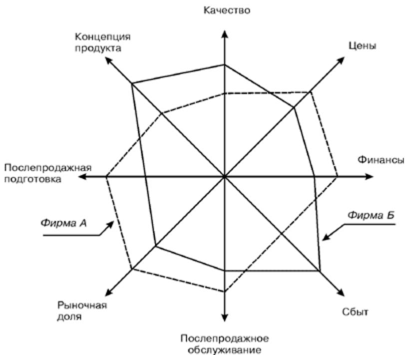
Рис. 1. Многоугольник конкурентоспособности

Изображая на одном рисунке многоугольники конкурентоспособности для разных фирм, легко провести анализ уровня их конкурентоспособности по разным факторам. Очевидно, что возможно построение многоугольника конкурентоспособности также для продуктов-конкурентов и маркетинговой деятельности фирм-конкурентов в целом.